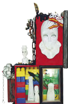
Edificio 2007 | pieza objetal

Su espíritu vital y enérgico retoma el legado de la cultura Pop que habita en el punto de partida de sus reflexiones y actuaciones más elementales. Algunas de estas actitudes indiscutiblemente postmodernas que habitan en Jarr son la consideración del coleccionismo como arte, inserto dentro del shopping como expresión cultural, el ideal del objet trouvé o su tendencia a objetualizar conceptos dentro de vitrinas que, a modo de Museo Imaginario, conservan la vida artificial de sus iconos y referentes de su universo creativo. Toda ello, en consonancia con su trazo pictórico que ha ido evolucionando de una forma muy personal, como un elemento imprescindible de su naturaleza artística que tiende a la combinación de lenguajes en