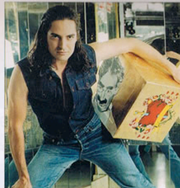
Buenos Aires. En 2002 participa en la II Bienal Internacional de Arte de la capital argentina.