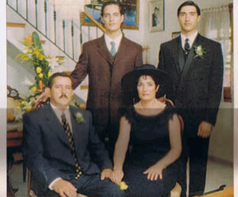
Su familia. Su familia es muy importante para él. En la imagen minutos antes del enlace de su hermano Eufemio.