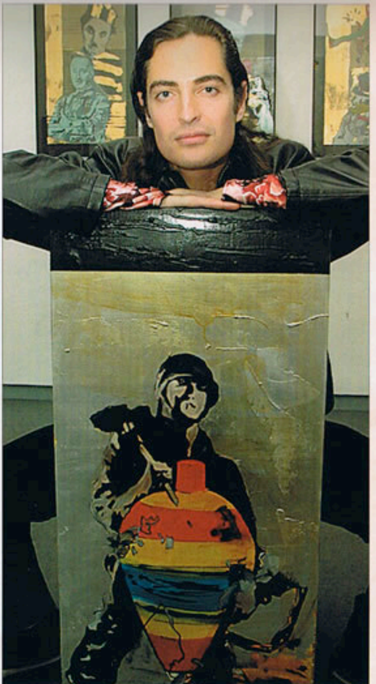
Cartoons. Jarr vive en una continua evolución y experimentación que queda plasmada muy claramente en su serie 'Cartoons'.