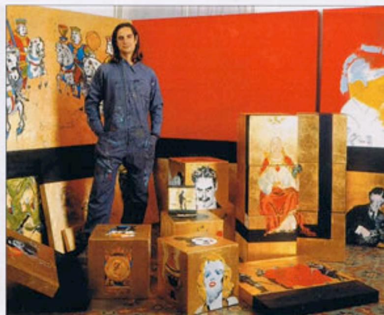
Con la música. Su colección 'Mística de la Música' se ha visto en fundaciones y obras sociales. En la actualidad prepara 'Art en Ruta'.