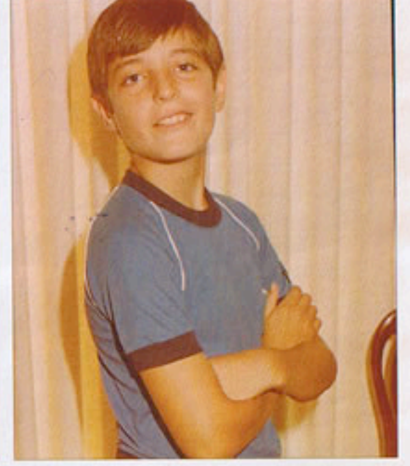
11 años. Sus inquietudes vitales lo llevaron enseguida a participar del mundo del arte.